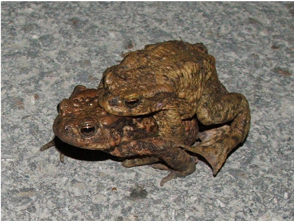
Abbildung 3: Krötenwanderung zum Laichplatz.

Er bezweckt den Schutz der Erdkrötenpopulation sowie aller anderer Amphibienarten im Raum Kehrsiten. Er unterstützt sämtliche Tätigkeiten und Projekte, die in diesem Zusammenhang stehen. Insbesondere erstellt und unterhält er Amphibienschutzzäune und gewährleistet eine möglichst gefahrlose Strassenüberquerung der Amphibien.