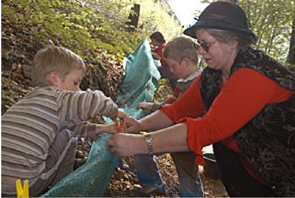
Abbildung 2: Tatkräftige Unterstützung.